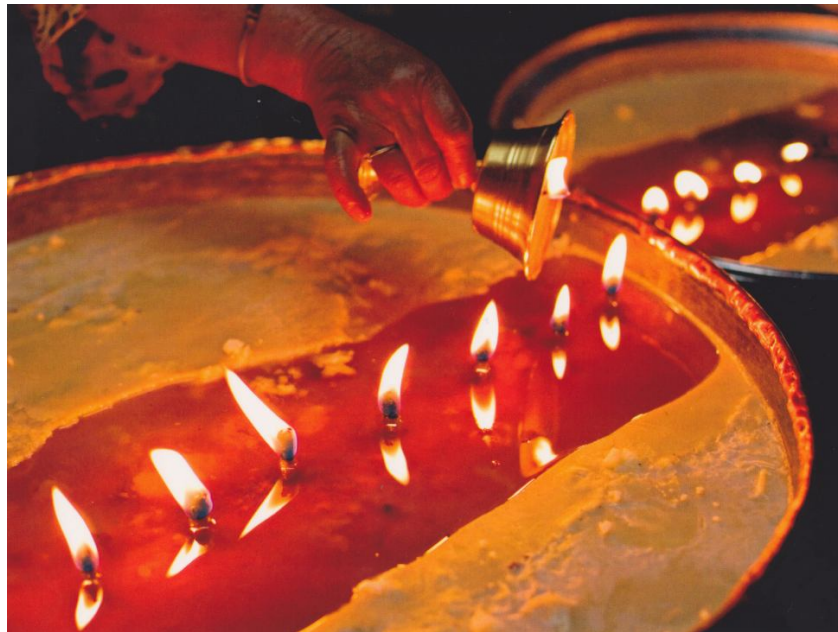
Dit kan je ook met boter doen... (Tibetaanse ghee boterlamp)

Het Netwerk Vitale Landbouw en Voeding (NVLV) is een landelijke beweging voor vernieuwende werkwijzen in bodembeheer, land- en tuinbouw en boer-burger verbanden. Het netwerk bestaat uit organisaties, burgers en ondernemers, die ieder vernieuwend bezig zijn en gezamenlijk in themagroepen en deelnetwerken kennis en ervaring uitwisselen en ontwikkelen.